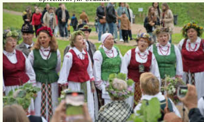
Johannesfestes in Kernave