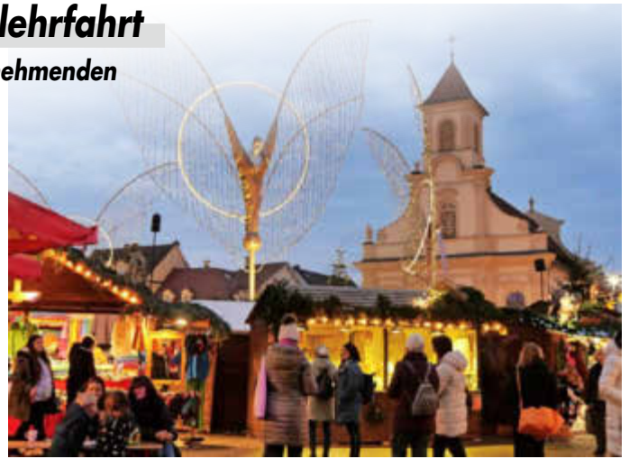
Die beleuchteten barocken Engel auf dem Marktplatz zählen zu den bekanntesten Symbolen des Ludwigsburger Weihnachtsmarktes.

Insgesamt fuhren 598 Landkreisbewohnerinnen und eine kleine Anzahl an Männern bei den elf Fahrten zwischen dem 29. November und 14. Dezember 2024 mit. In jedem Bus übernahm eine Frau aus der BBV-Kreisvorstandschaft oder eine Ortsbäuerin die Reiseleitung. All das erforderte von den Ehren- und Hauptamtlichen des BBV-Kreisverbands Würzburg eine logistische Leistung.