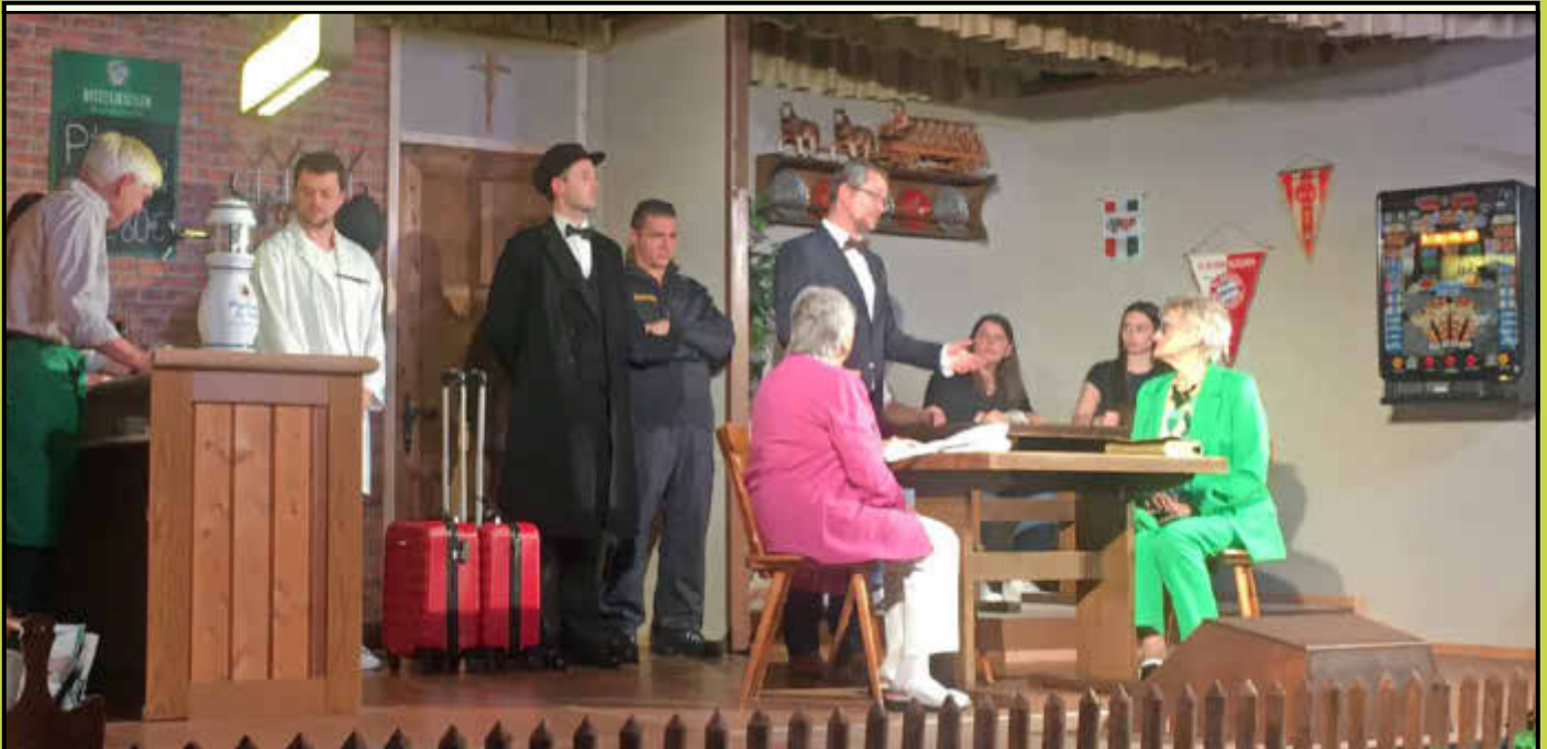
Die Schlusszene: Der Graf und sein Butler reisen ab

mit den Mitteilungsblättern der VGem. Bergtheim, der Gemeinden Hausen und Unterpleichfeld