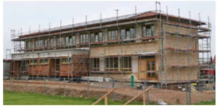
In Opferbaum ist der Baufortschritt beim Umbau der ehemaligen Schule in eine Kindertagesstätte deutlich sichtbar. Wie die Außenanlage gestaltet werden soll, die Verkehrsführung in der Jahnstraße einmal aussehen wird und wo genau die nötigen Parkplätze für die Kita angelegt werden, ist noch in Planung.

In der Nachbargemeinde Oberpleichfeld wären zwar „drei bis vier Plätze“ frei gewesen, aber die betroffenen Eltern sind nicht mobil. Deshalb habe die Gemeinde einen Aufruf mit der auf dieses Kindergartenjahr befristeten Bitte um Hilfe gemacht. Aber es hätten sich keine ehrenamtlichen Fahrerinnen oder Fahrer gemeldet und die Beauftragung eines Beförderungsunternehmens hätte laut Bürgermeister Schlier „17.000 Euro Kosten nach sich gezogen“.