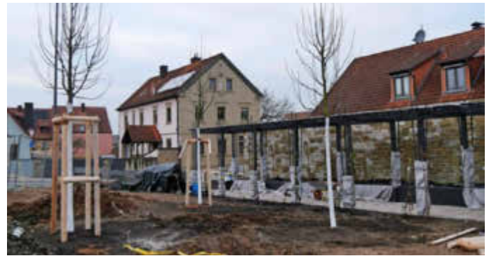
Das Umfeld am Kreisverkehrsplatz beim Zusammentreffen der Kreisstraßen Wü 3 und Wü 5 wird neu angelegt.

Einhellige und freudige Zustimmung im Ratsgremium fand eine Idee und das Ergreifen der Initiative von Bürgermeisterin Rottmann. Sie möchte bei der Kommunalen Allianz Würzburger Norden einen Zuschuss über das Regionalbudget bean-