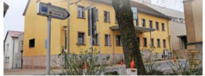
Das Rathaus in Bergtheim ist Sitz der Verwaltungsgemeinschaft Bergtheim.

und tritt am 1. Januar 2025 in Kraft. Einstimmig war auch die Zustimmung zum Finanzplan für die Jahre 2024 bis 2028.