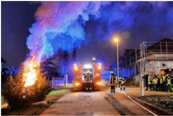
Für die Kinder bei der Opferbaumer Kinderfeuerwehr Firefighters (rechts) demonstrierten Feuerwehrmänner, wie schnell und gefährlich ein Tannenbaum brennen kann und wie die Feuerwehr einen derartigen Brand löscht.