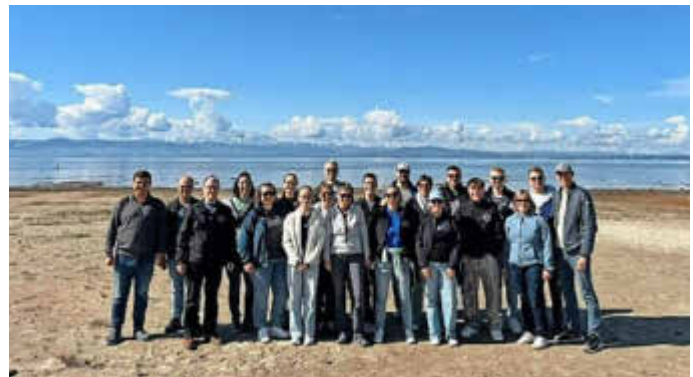
Orchesterfahrt an den Bodensee

Unsere Freunde vom Gesangverein übernahmen engagiert die Bewirtung mit Leberkäse, Stängchen und Getränken vor dem Konzert, in der Pause und bei unserer Aftershowparty, die den Abend zu einem großen Fest der Musik gemacht hat. Eindrücklich zeigte der Abend das große Engagement in unserem Verein, die Begeisterung und die Freude an der Musik, die auch bei unserem Publikum angekommen ist, das uns mit Standing Ovationen belohnte. Traditionell beschlossen wir unser Konzert mit unserem Marsch „Musik und Wein – mein Thüngersheim!“