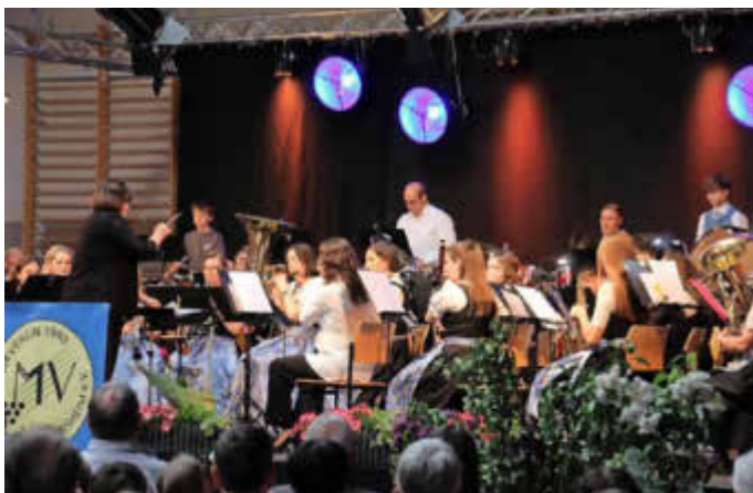
Jahreskonzert Musikverein Thüngersheim e.V.

Als Kleines Schmankerl erklang mit dem französischen Lied „Valse pour Jeannette“ das Instrument des Jahres 2026 – Das Akkordeon in kleiner Besetzung mit Gitarre, Bass und Saxophon.