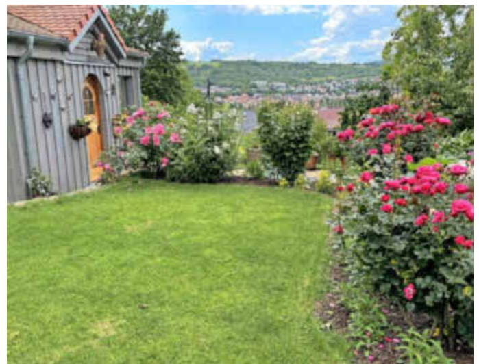
Am Tag der offenen Gartentür im Landkreis Würzburg öffnen am 14. Juni zahlreiche Gartenbesitzerinnen und -besitzer die Pforten zu ihren Anwesen. Einen lohnenden Ausblick haben Besucherinnen und Besucher unter anderem im Garten von Familie Grimm in Veitshöchheim.