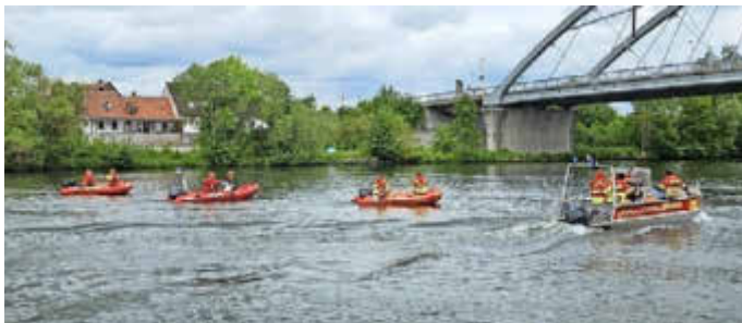
Boote auf dem Main bei Grafenrheinfeld